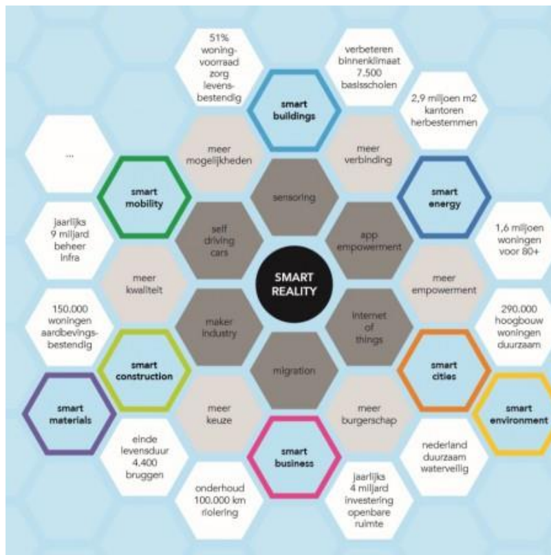
Figuur; Themakaart Bouw

Volgens de laatste cijfers van het CBS was de bouw in het derde kwartaal van 2016 de sterkst groeiende bedrijfstak van de Nederlandse economie. De toegevoegde waarde lag 9,5 procent hoger dan in dezelfde periode vorig jaar. Met een jaarlijkse productie van zestig miljard euro is de bouw een van de grootste sectoren van de Nederlandse economie. In de sector zijn ruim een half miljoen mensen werkzaam